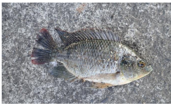
水棲生物照片-吳郭魚