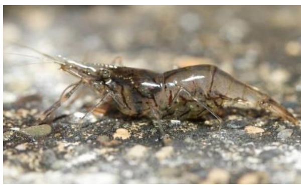
水棲生物照片-南海沼蝦