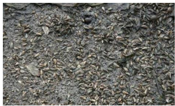
河道底部似殼菜蛤