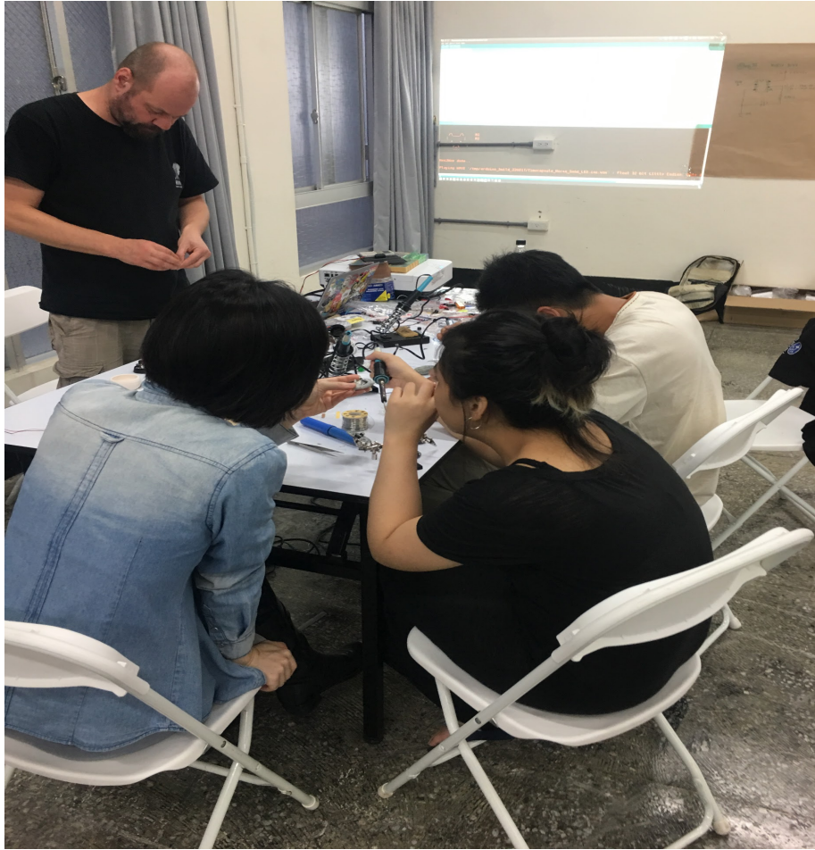
最後剩下就是大家自主完成的時間