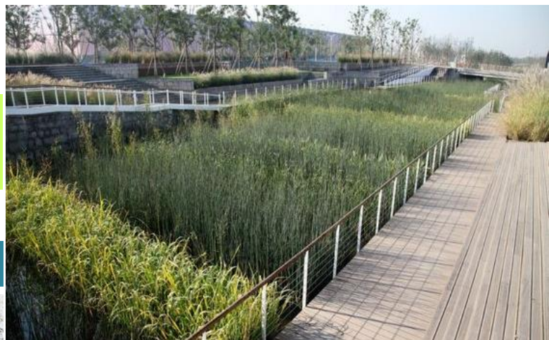
下游水岸平臺+欄杆改善示意圖