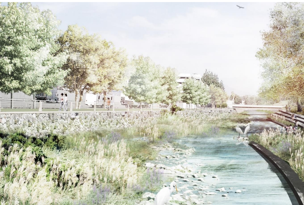
水岸水防道路綠廊營造示意圖