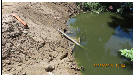
公學路下游過水路已埋設涵管