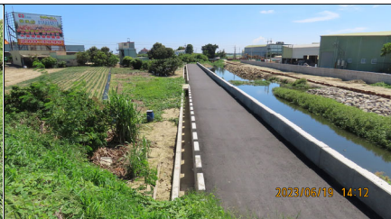
安吉路下游左岸防汛道路 AC 已鋪設