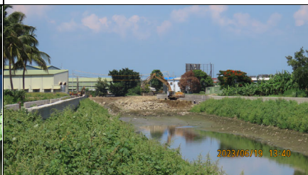
施工起點與下游段工程銜接處水域未受阻，但水位低呈斷流情形