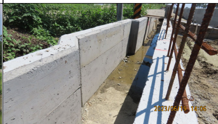
動物逃生通道預留位置 23.06752, 120.189188