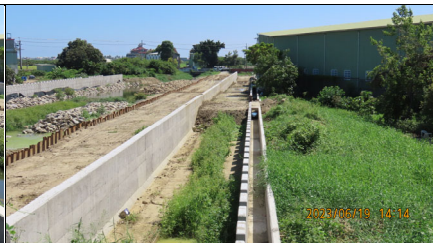
安吉路下游右岸防汛道路路基尚未整理