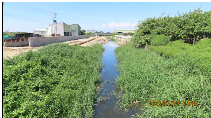
安吉路至公學路施工狀況，石籠護岸區段兩岸濱溪尚未擾動