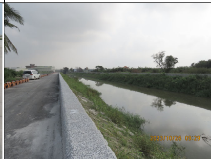
工程起點與前期工程銜接處