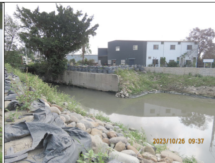
公學路下游無民生垃圾