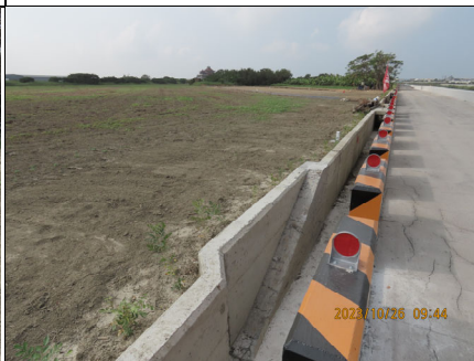
側溝動物逃生通道及新植灌木