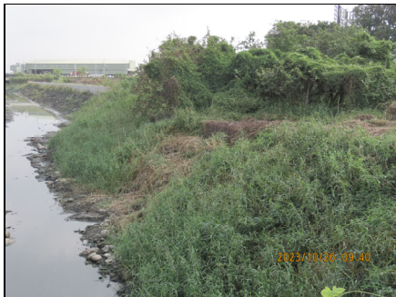
公學路上游左岸石籠護岸濱溪帶