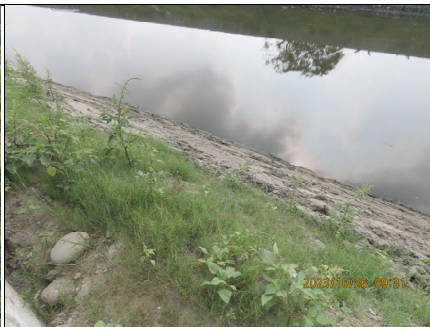
堤前土坡播撒草籽已發芽