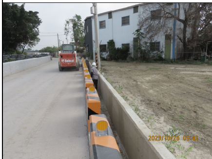
施工廠商清除側溝淤泥