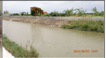
工程起點與前期工程銜接處