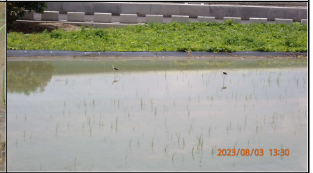
附近農田淹水吸引高蹺鴿停棲