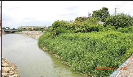
公學路上游左岸石籠護岸濱溪帶 未擾動