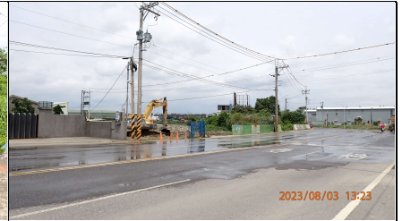
公學路確實灑水抑制飛塵