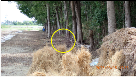
小葉欖仁造林地發現環頸雉(II)