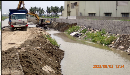
復原河道中施工便道，溪水暢通