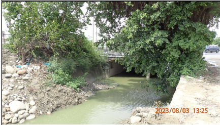
公學路下游無民生垃圾