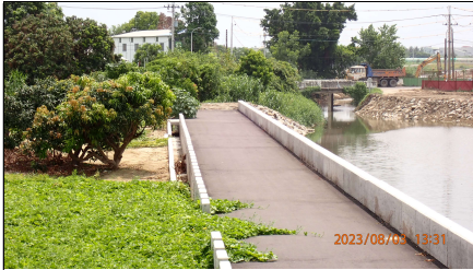
安吉路至公學路施工狀況，左岸 防汛道路已鋪設 AC