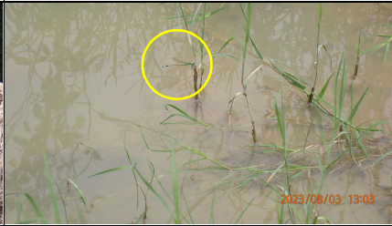
防汛道路降雨積水處之青紋細螳