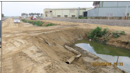
公學路下游過水路阻斷水流