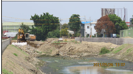
施工起點溪水斷流