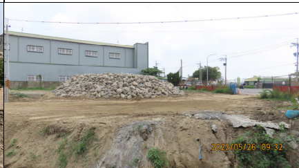
塊石暫置區利用裸露地