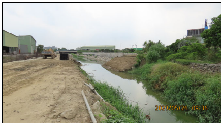
安吉路至公學路施工狀況，石籠護岸區段兩岸濱溪尚未擾動