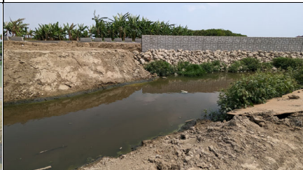
施工起點與下游段工程銜接處水域未受阻