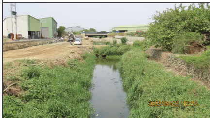
過水路至公學路施工狀況，石籠護岸區段兩岸濱溪尚未擾動