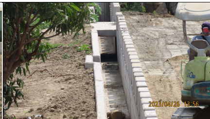
左岸動物逃生通道位置