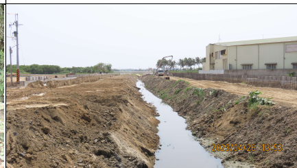
公學路至與上下段工程施工狀況