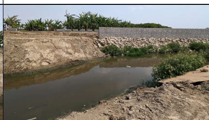
施工起點與下游段工程銜接處水域未受阻