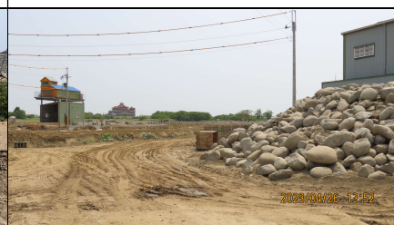
塊石暫置區利用裸露地