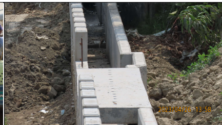
右岸動物逃生通道位置