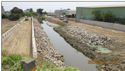
安吉路至過水路施工狀況