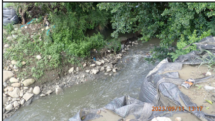
公學路下游無民生垃圾