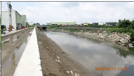
安吉路至公學路提前土坡草籽已撒播，尚未發芽