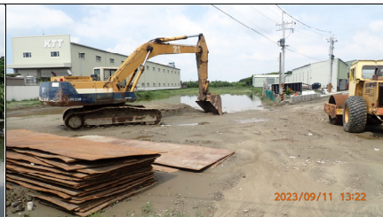
暫置區退場復原中