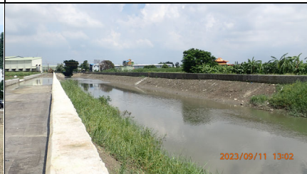
工程起點與前期工程銜接處