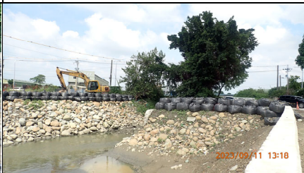
河道中施工便道撤除