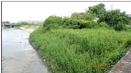
公學路上游左岸石籠護岸濱溪帶未擾動