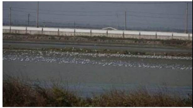
周邊魚塭聚集紅嘴鷗