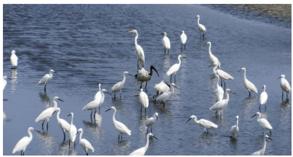
水棲生物照片-大、小白鷺及埃及聖鸛