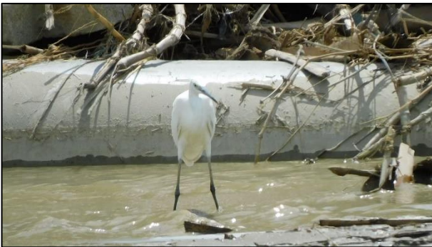
小白鷺於工區水域覓食