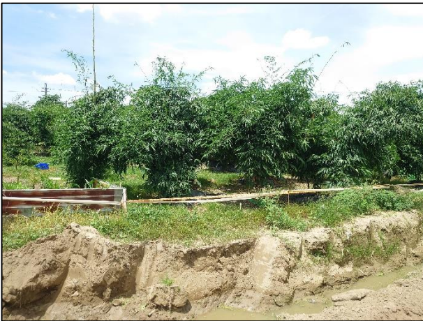
諸羅樹蛙鳴叫處竹林維護良好