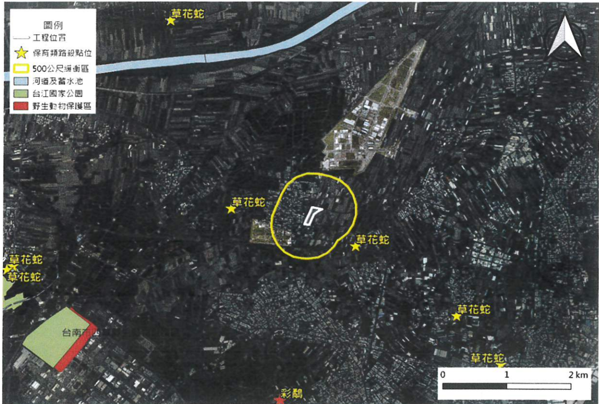
大尺度工程生態情報圖