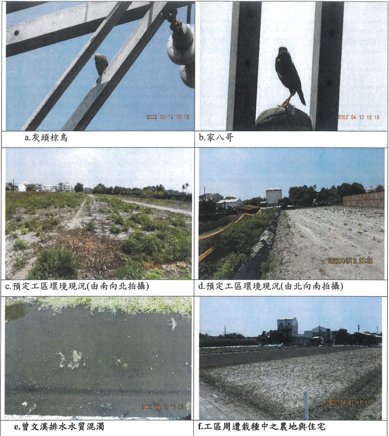
圖 1、曾文溪排水十二佃疏洪箱涵(樁號 1K+600~1K+900)新建工程併辦土石標售工程現場勘查狀況