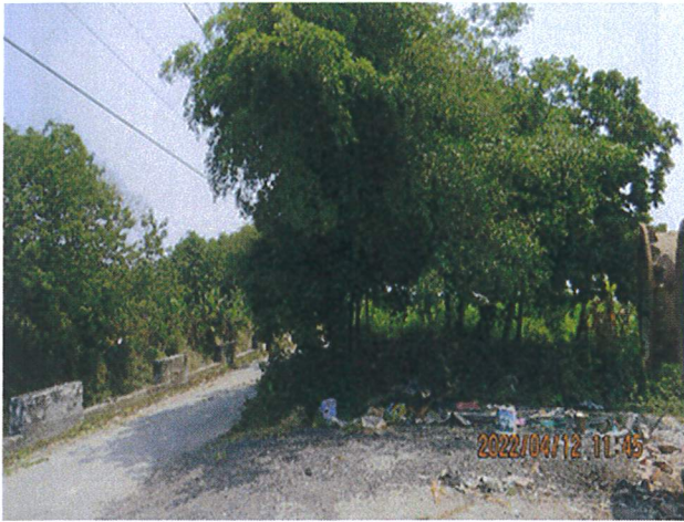
日期：111/4/12 拍攝 說明：工區東北側原有茄冬樹及小葉欖仁