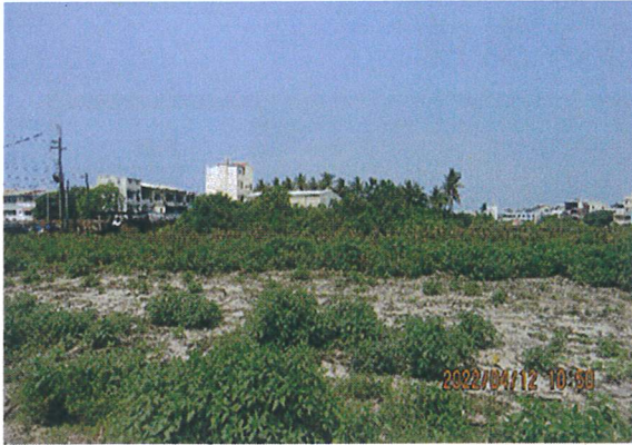
日期：111/4/12 拍攝 說明：施工時避免工區外大面積草生地擾動