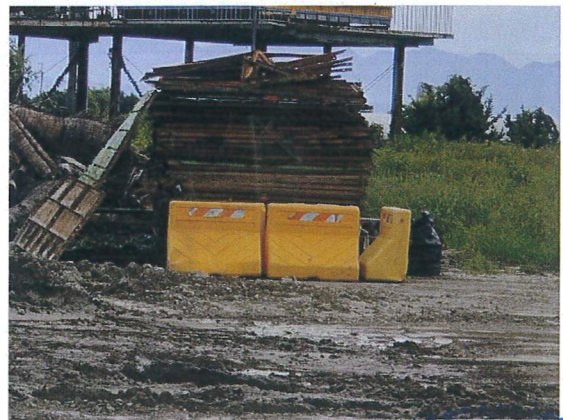
日期：111.06.29 拍攝 說明：施工便道及器材堆置區優先利用既有裸地