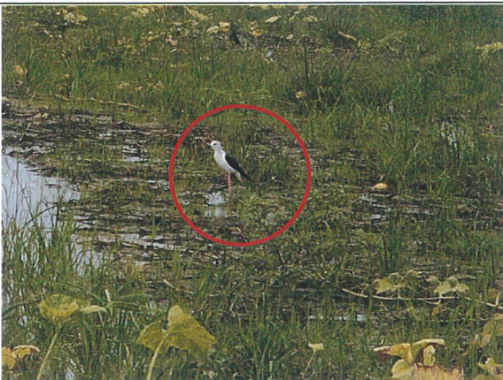
日期：111.06.20 說明：於1K+600 發現高腳鴿