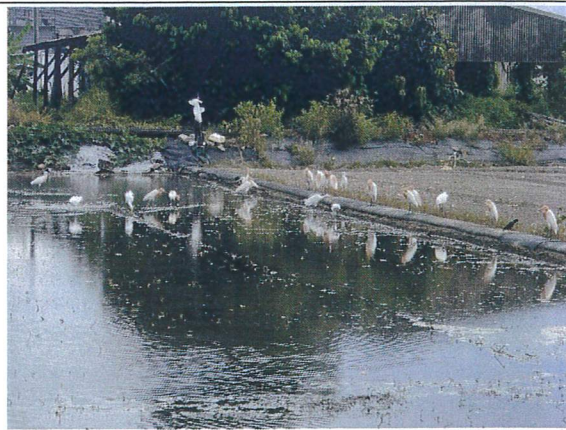
日期：111.06.22 說明：於1K+800 發現白鷺鷥群聚