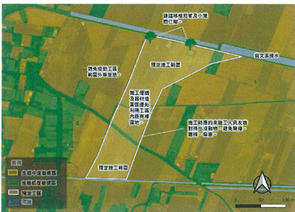
日期：111/4/12 說明：施工便道及器材堆置區優先利用既有裸地