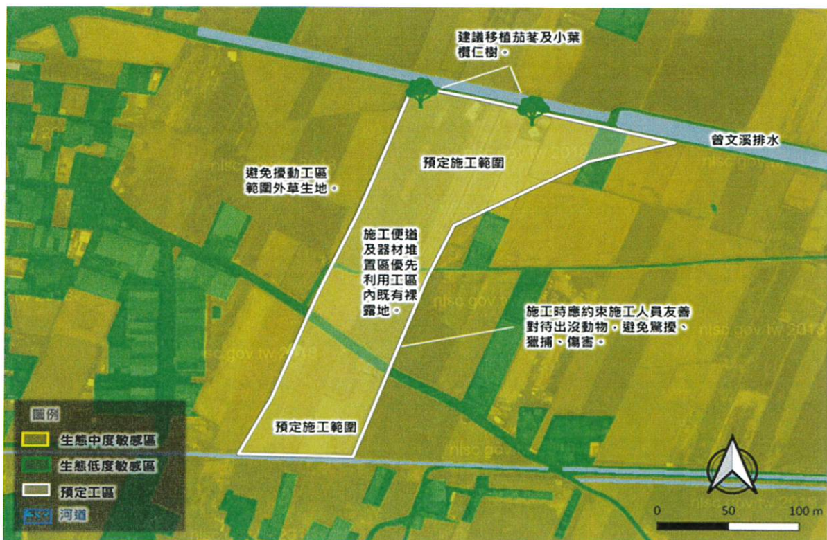
小尺度生態關注區域圖