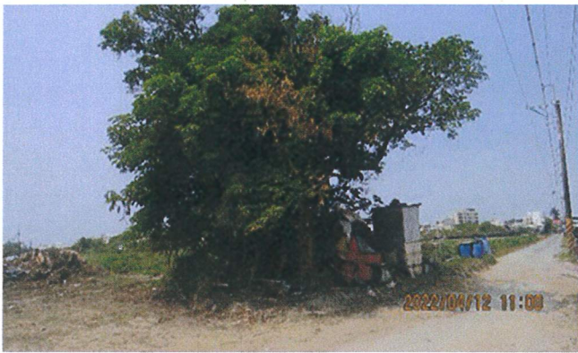
日期：111/4/12 拍攝 說明：工區西北側茄冬樹。