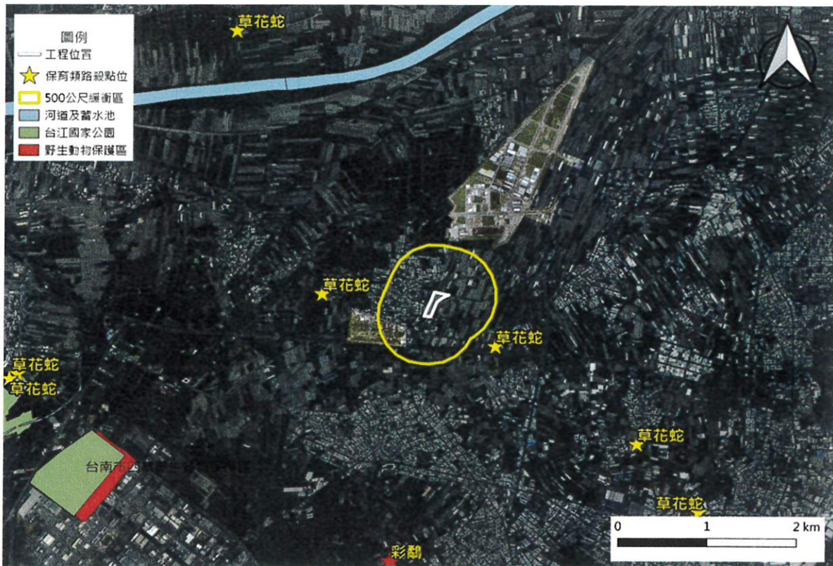
大尺度工程生態情報圖