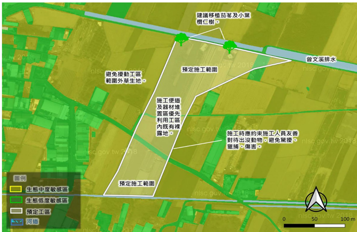
小尺度生態關注區域圖