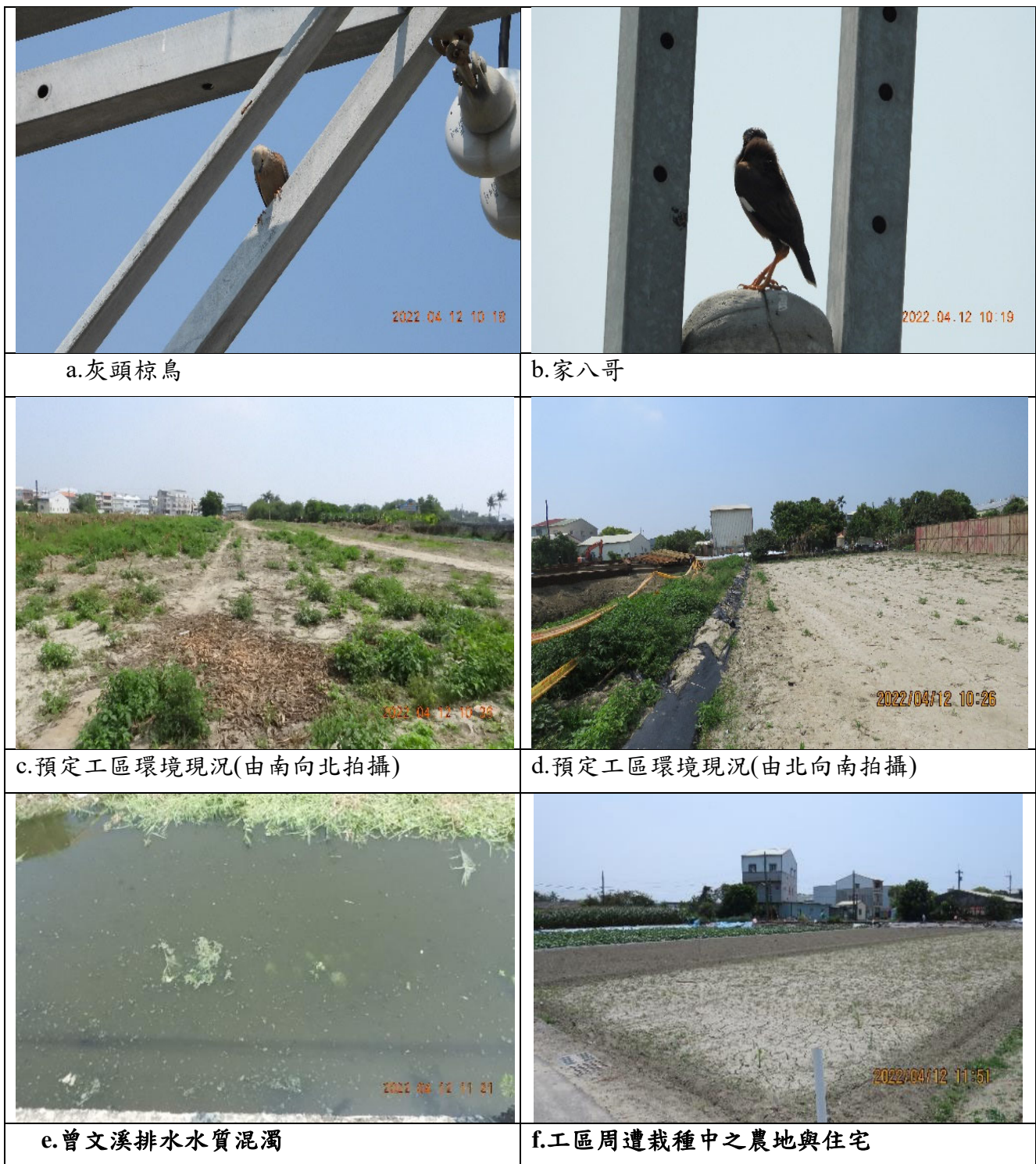
圖 1、曾文溪排水十二佃疏洪箱涵(樁號 1K+600~1K+900)新建工程併辦土石標售工程現場勘查狀況