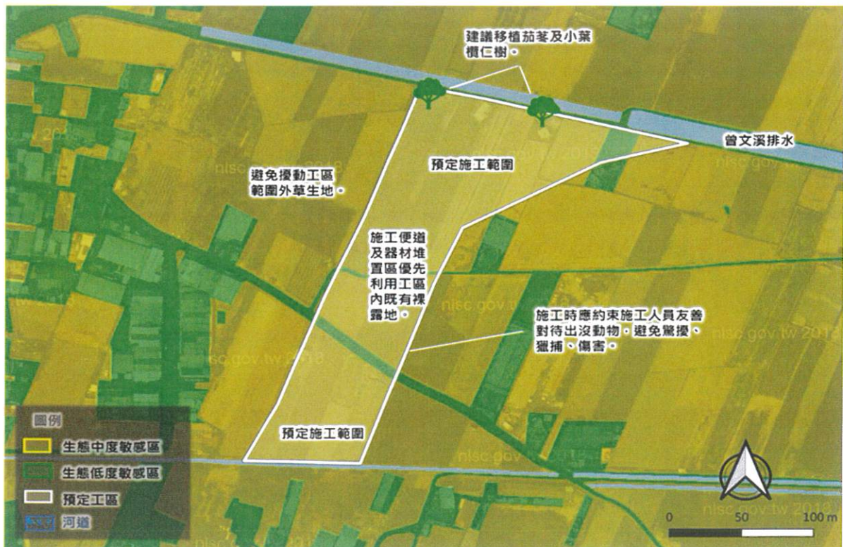
小尺度生態關注區域圖