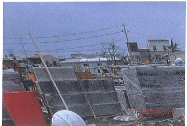
日期：111/4/12 說明：施工便道及器材堆置區優先利用既有裸地