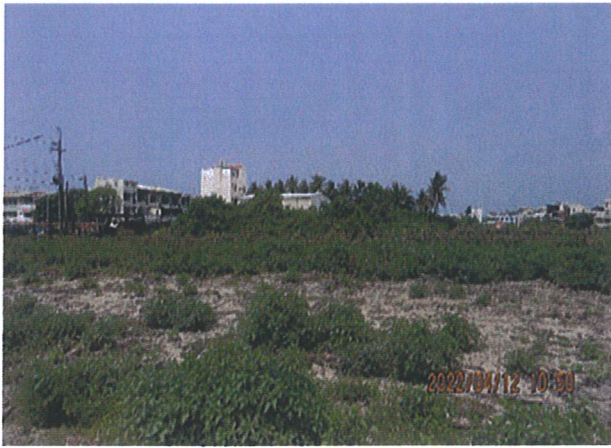
日期：111/4/12 拍攝 說明：施工時避免工區外大面積草生地擾動