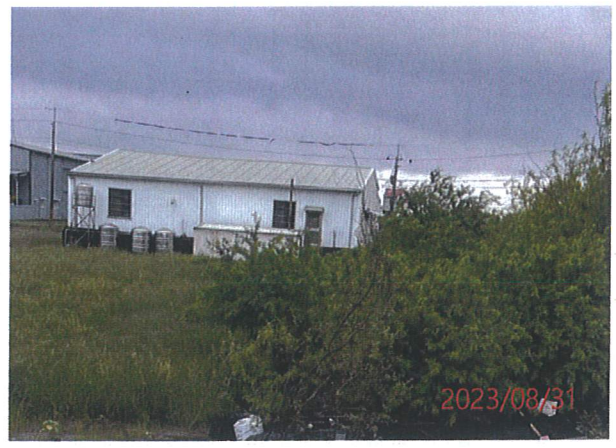
日期：112. 08. 31 說明：除施工道路外保留原地面植披