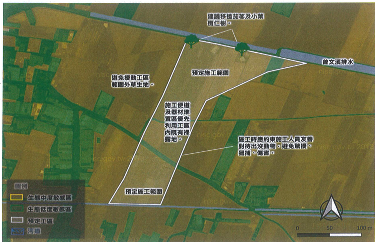
小尺度生態關注區域圖