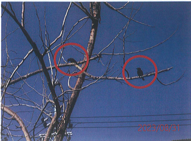
日期：112. 08. 31 說明：於1K+900 發現亞洲輝椋鳥