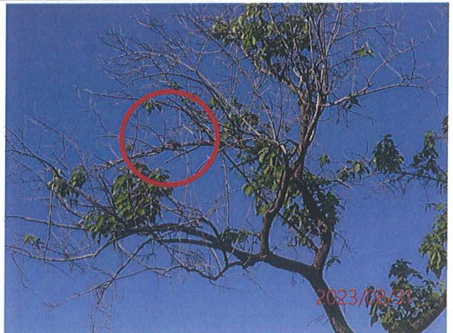
日期：112. 08. 31 說明：於1K+830發現家八哥