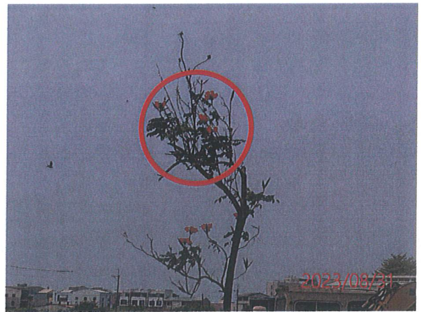
日期：112. 08. 31 說明：施工時應善待工區內出沒動物