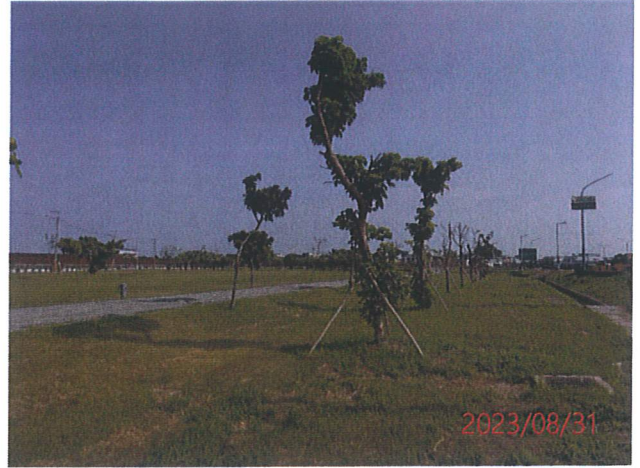
日期：111/4/12 拍攝 說明：工區東北側原有茄冬樹及小葉欖仁