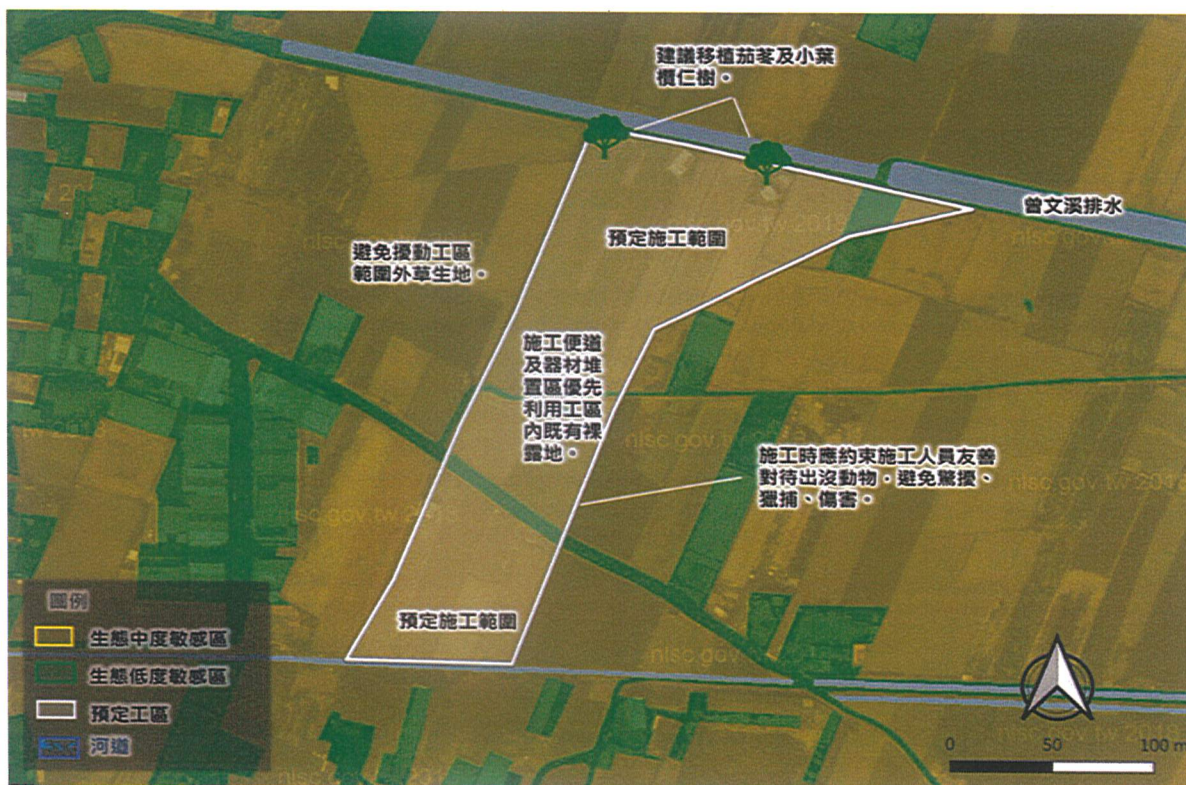
小尺度生態關注區域圖