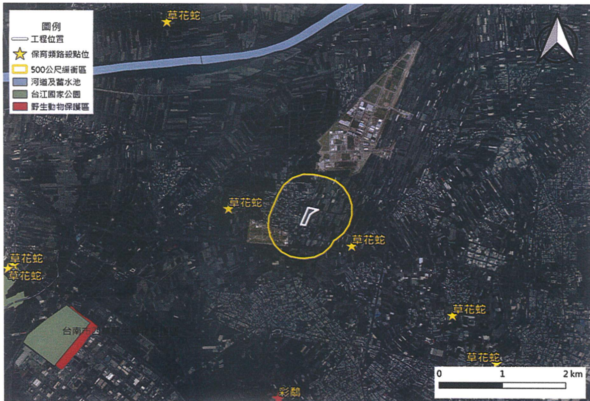
大尺度工程生態情報圖