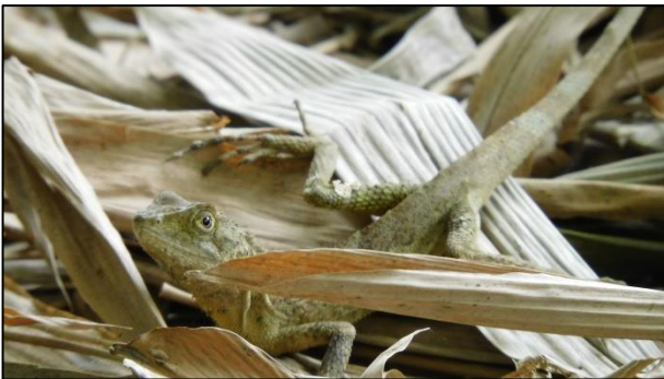
斯文豪氏攀蜥於竹葉底層爬行