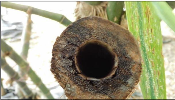
竹林內之竹洞積水處供樹蛙棲息