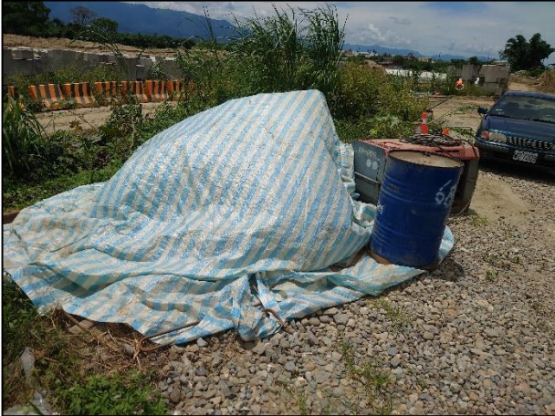
裸露地設置臨時堆置區