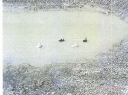
圖 2：109.09.21 工區出沒動物