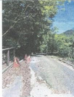
圖 1：109.09.21 施工便道現況