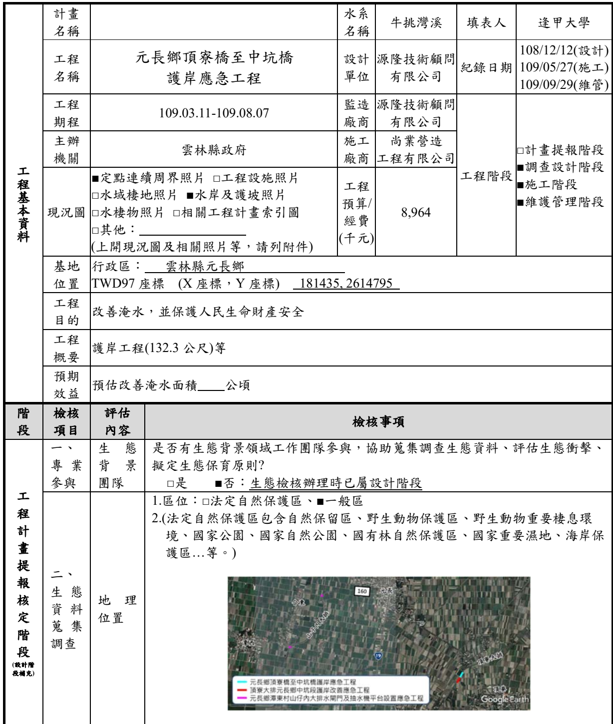
水利工程生態檢核自評表