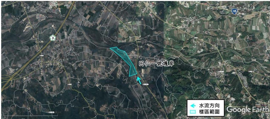
「澧水溪匯流口~斷面 5」地理位置及堤防