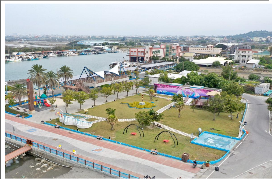
圖 4 遊憩設施(鞦韆)