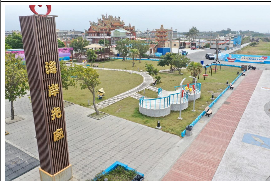
圖 5 入口意象改善