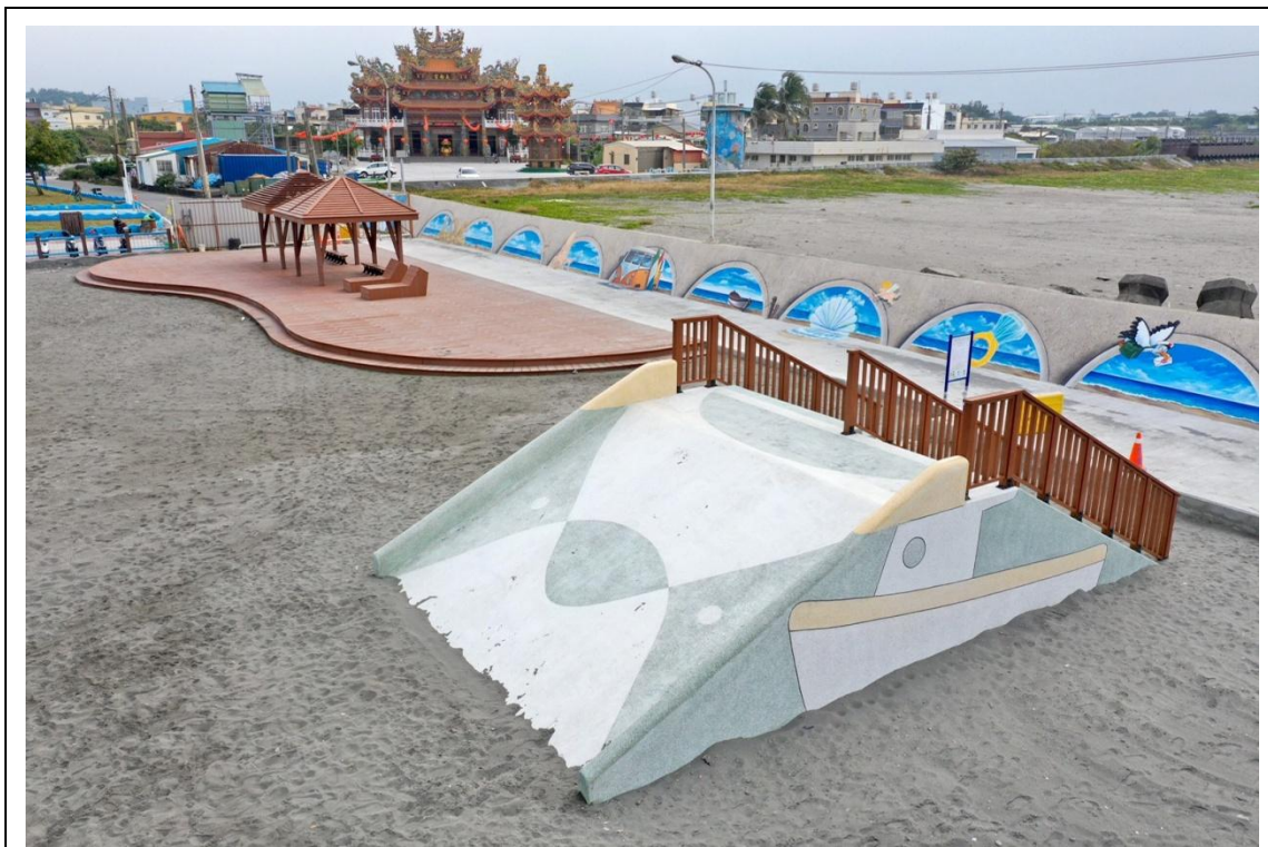
圖 1 休(遊)憩設施及堤防彩繪