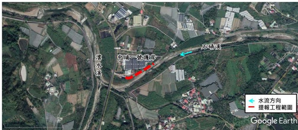
中埔 1 號護岸段工程工程預定位置圖