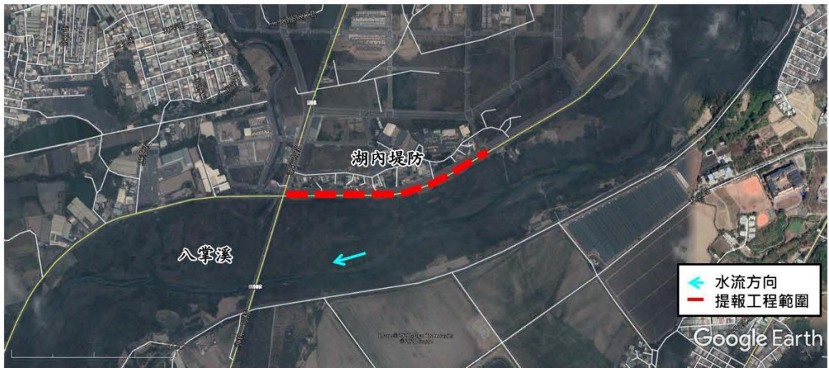
八掌溪魅力河段環境營造改善工程(一工區)工程預定位置圖