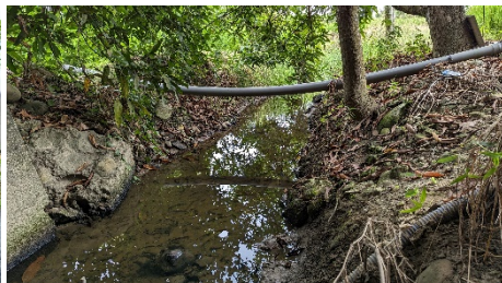
b. 埤麻腳230號附1無名橋下水域環境