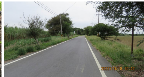
c. 北段兩側特稀有植物：榔榆(NT)、臺灣欒樹(特有)需移植