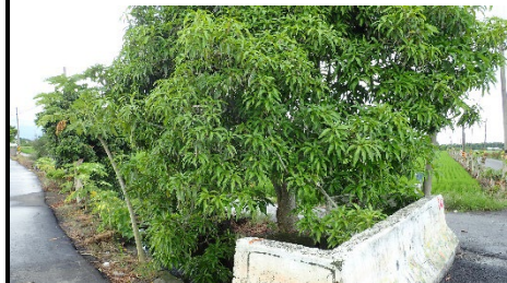
a. 太保無名橋芒果樹 (23.478578, 120.386713)

7.生態保全對象之照片：應以特寫與全景照方式記錄生態保全對象，提供現地操作人員辨識。