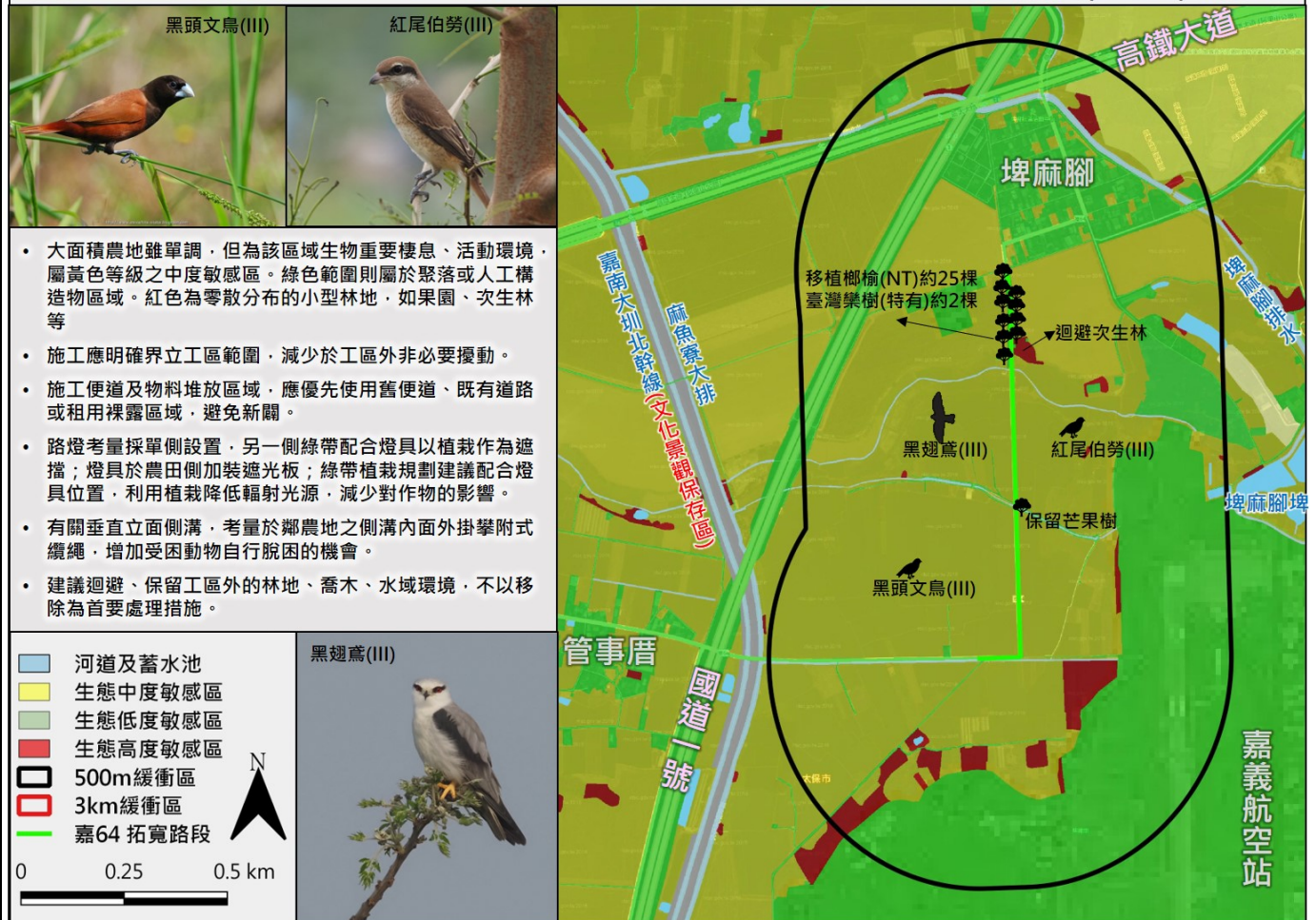
嘉64線6k+050~7k+050段埤麻腳至港尾里管事厝拓寬工程-生態關注區域圖(小尺度)

以平面圖示標繪治理範圍及其鄰近地區之生態保全對象及潛在生態課題，可依設計期程分別以基本設計圖與細部設計圖/維護管理階段竣工圖套疊繪製生態關注區域圖，以更精確地呈現工程設計與生態關注區域和生態保全對象的位置關係。應配合工程設計圖的範圍及比例尺進行繪製，比例尺以1/1000為原則。繪製範圍除了工程本體所在的地點，亦要將工程可能影響到的地方納入考量，如濱溪植被緩衝區、施工便道的範圍。若河溪附近有道路通過，亦可視道路為生態關注區域圖的劃設邊界。應標示包含施工時的臨時性工程預定位置，例如施工便道、堆置區等。