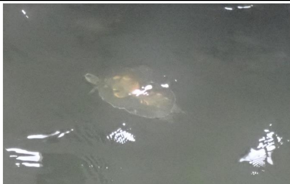
水棲生物照片-斑龜