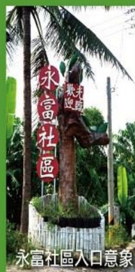
永富社區入口意象

景義國小參觀校園裡的陣頭文化裝置藝術→龍山腳下大啖美味土雞大餐，遙望龍山麒麟捲尾吐珠地理美景→龍山聚善堂，全台最大濟公活佛雕像，聽濟公的故事→龍山休閒登山步道，沿途蝴蝶飛舞、果樹扶疏，登高望遠令人心曠神怡