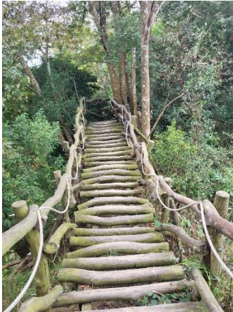
0.5K 處新設導覽說明牌 (228977, 2674786)