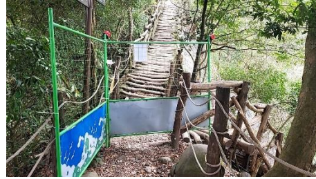
0.3K 處新設相思木平台及導覽解說牌/新設鳥箱 5 組 (228814, 2674767)