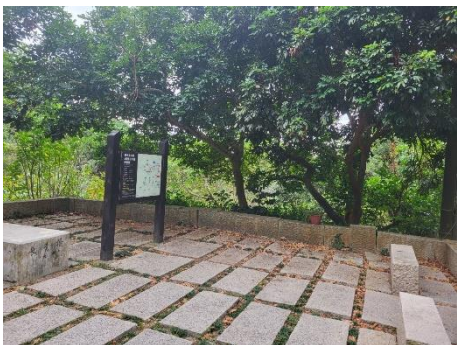
0 K 北橋台景觀綠美化