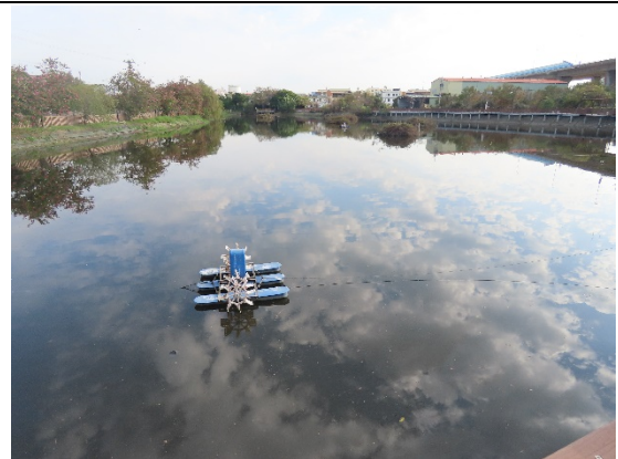
計畫周遭環境照片 (於113/01/08拍攝)