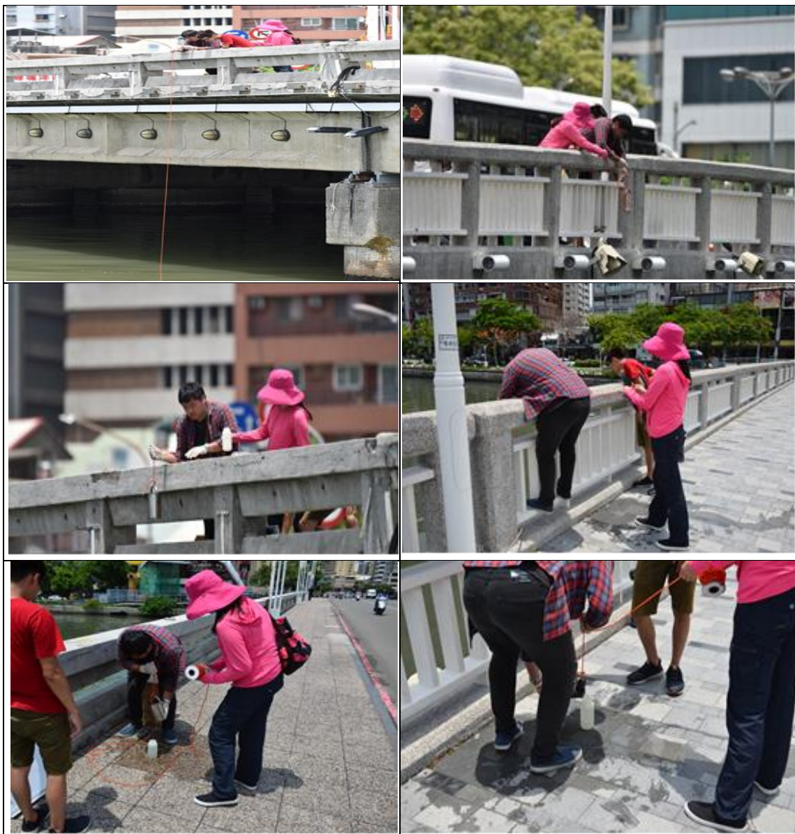
圖 1 107 年 7 月 23 日分別至七賢橋及五福橋執行現場採樣照

河川水質受天候及氣象的影響較大，一般以生化需氧量 (BOD)、溶氧 (DO)、酸鹼值 (pH)、氨氮、濁度及比導電度等項水質指標代表各類用水的品質。107 年 7 月 23 日 11 時 09 分及 11 時 43 分，本團隊分別至七賢橋及五福橋執行現場採樣 (如下圖 1)，並經檢驗分析後，愛河水域水質檢測項目結果如下表 4 及 5 所示：