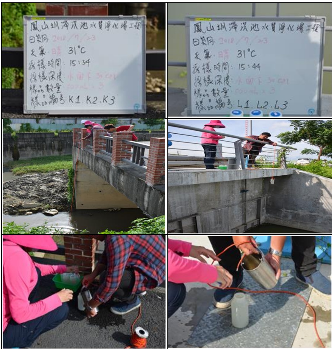
圖 1 107 年 7 月 23 日至鳳山圳滯洪池 K 點及 L 點執行現場採樣照

河川水質受天候及氣象的影響較大，一般以生化需氧量 (BOD)、溶氧 (DO)、酸鹼值 (pH)、氨氮、濁度及比導電度等項水質指標代表各類用水的品質。107 年 7 月 23 日 15 時 34 分 44 分及 54 分，本團隊分別至鳳山圳滯洪池 3 處執行現場採樣 (如圖 1、圖 2)，經檢驗分析後，鳳山圳滯洪池 3 處水域水質檢測項目結果如下表 4 至表 6 所示：