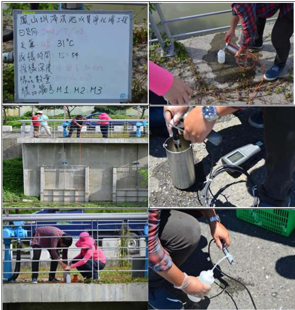
圖 2 107 年 7 月 23 日至鳳山圳滯洪池 M 點執行現場採樣照