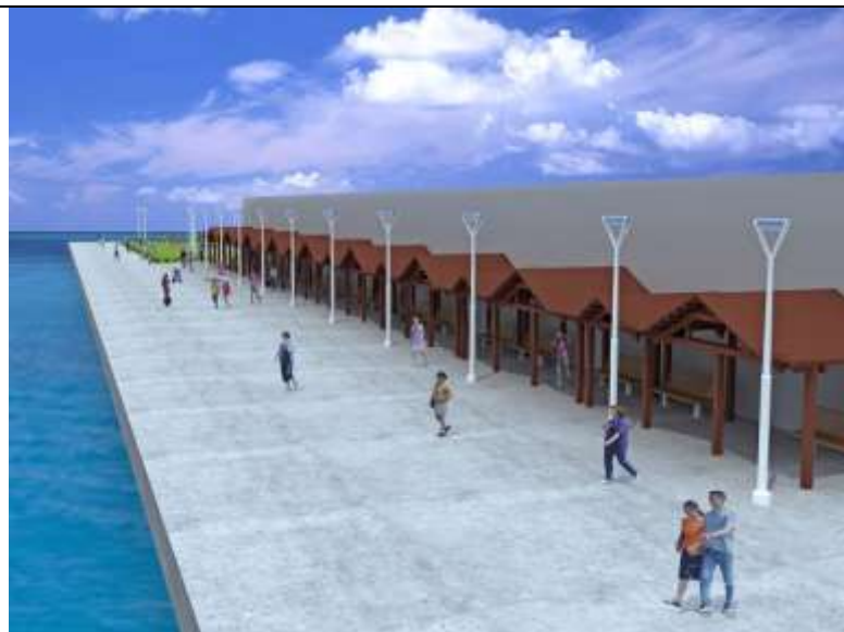
圖 13 本計畫工程構想模擬圖 1