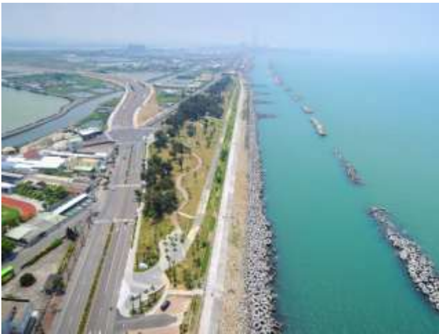
圖 5 茄荳海岸線