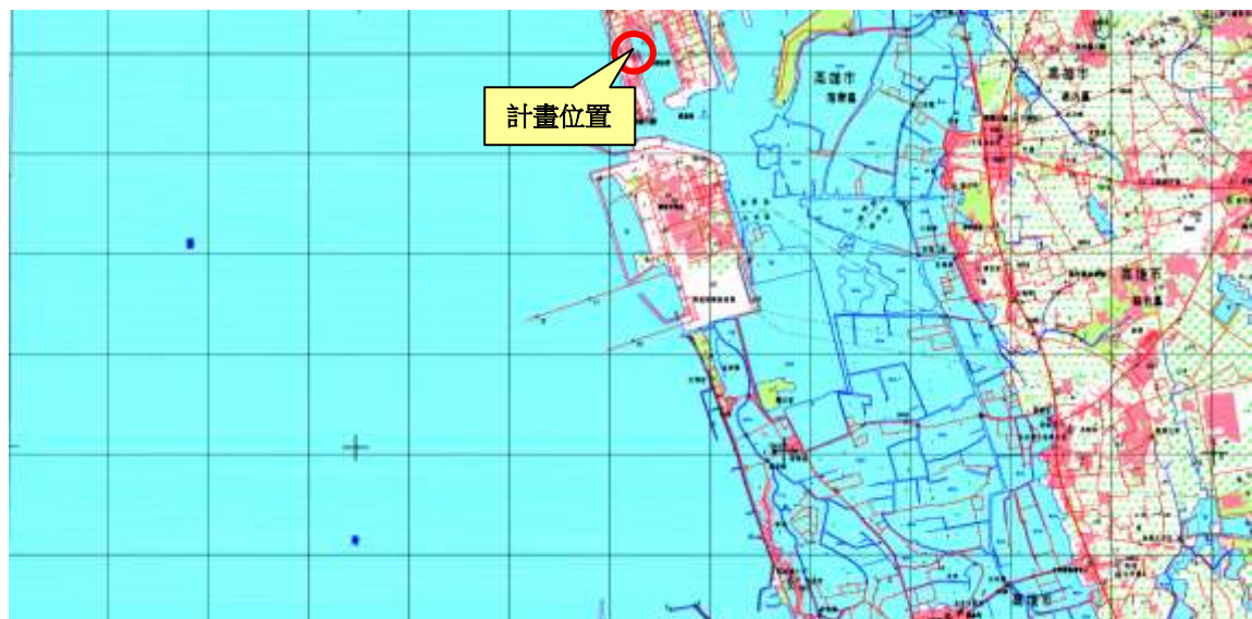
圖 2 計畫位置(經建版地圖)