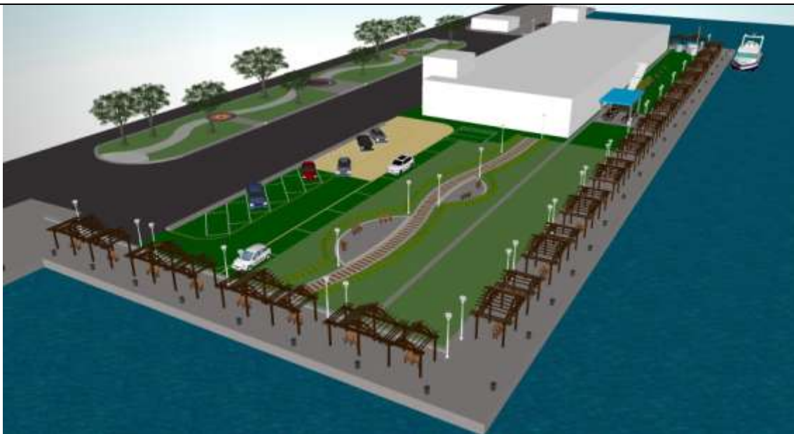
圖 16 本計畫工程構想模擬圖 4