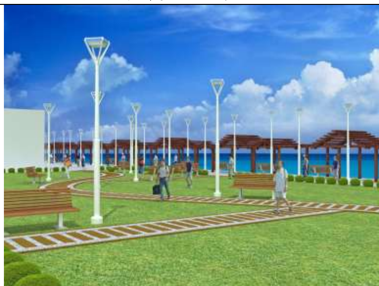
圖 14 本計畫工程構想模擬圖 2