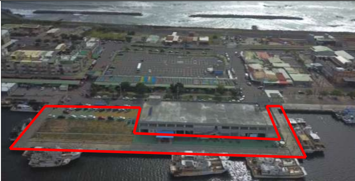
圖 3 計畫範圍