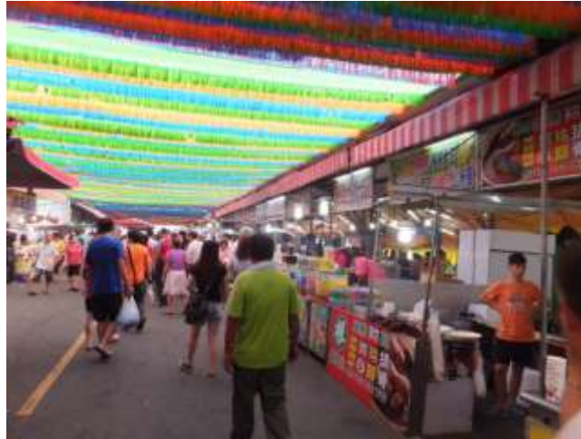
圖 11 大發路觀光魚市