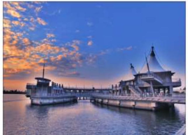
圖 8 興達港海上劇場 1