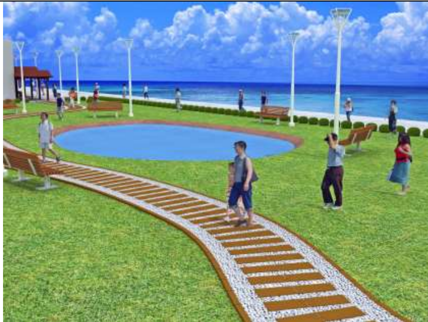
圖 15 本計畫工程構想模擬圖 3