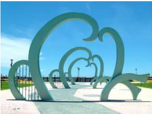
圖 7 興達港情人碼頭