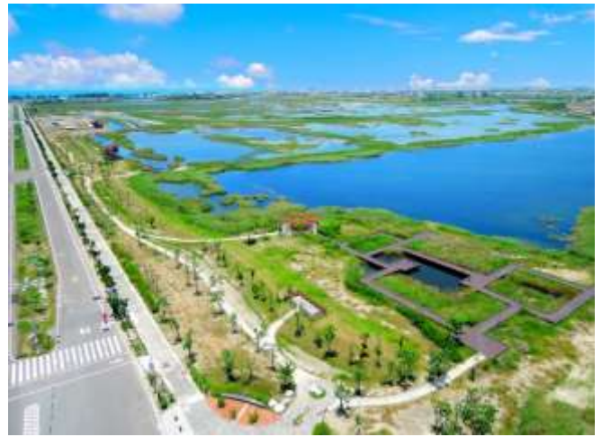
圖 6 茄荳濕地公園