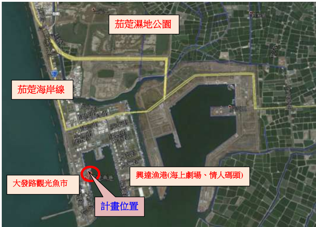
圖 4 計畫位置周邊景點