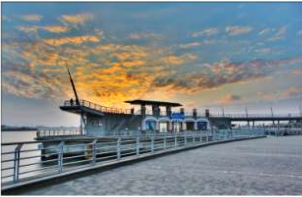
圖 9 興達港海上劇場 2