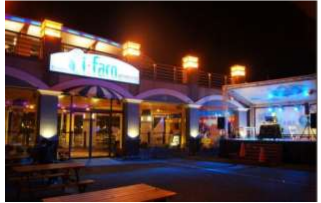
圖 10 興達港海景餐廳