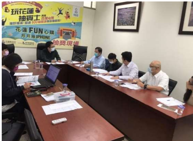
節電共識及推動會議