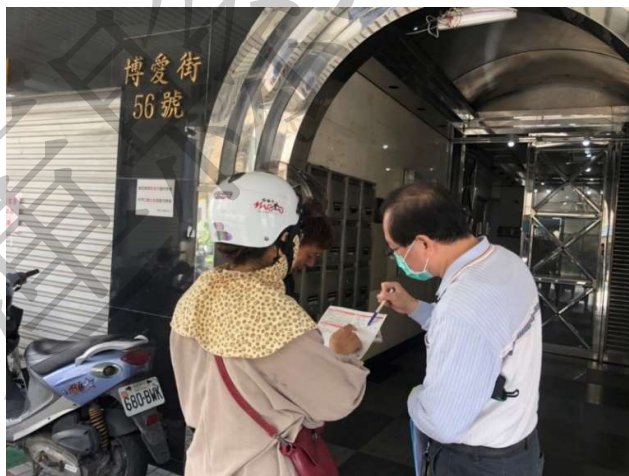
大型用電戶用電診斷