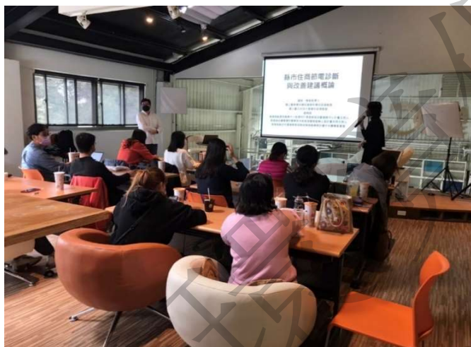
節能技術輔導大使團