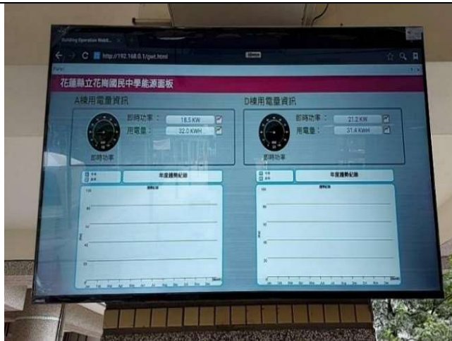
建置節能教育示範點