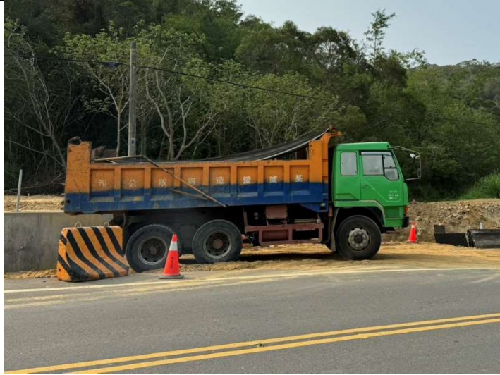
運送土方車輛，以防塵網覆蓋

工程名稱：128 線通霄路段(通霄交流道 3K+600 至烏眉國中 4K+900) 拓寬工程