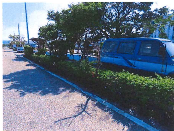
日期：民國 112 年 12 月 15 日 未擾動左岸既有綠化空間

5 右岸道路有木棉數棵，道路北側設置樹穴改善樹木生長環境；道路南側(河道內)木棉配合移植，降低對整體環境造成影響。