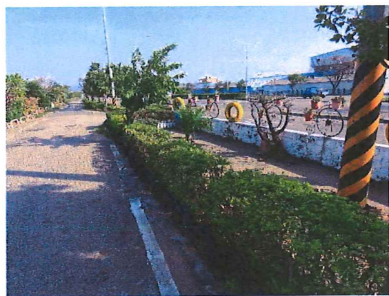
日期：民國 112 年 08 月 22 日