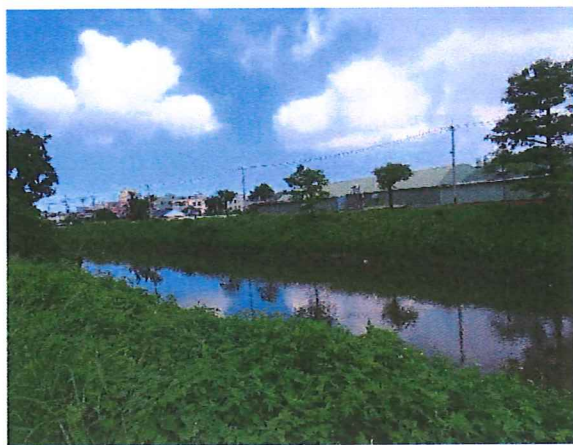
日期：民國 112 年 08 月 22 日