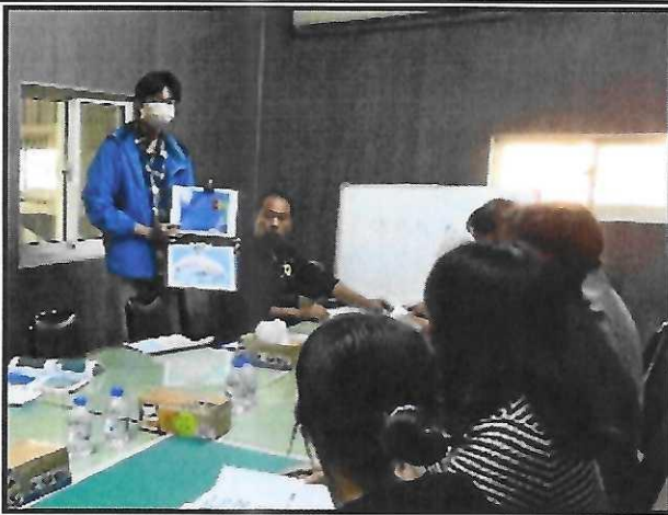
關注物種辨識及分布說明