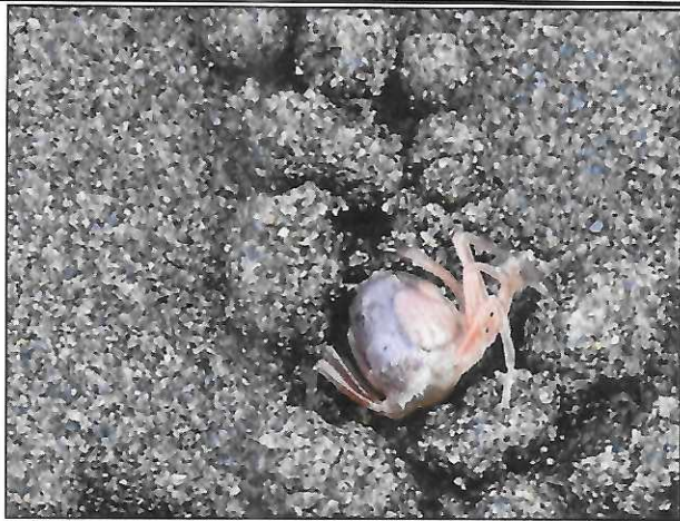
短指和尚蟹於外傘頂洲