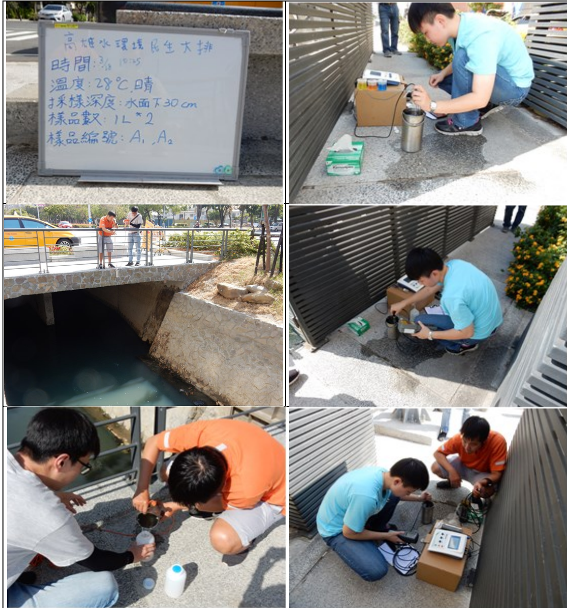
圖2 108年3月18日民生大排現場採樣照

108年3月18日10時25分，本團隊至民生大排現場採樣（如下圖2）檢驗分析後，民生大排水質完工階段檢測項目結果如下表4所示：