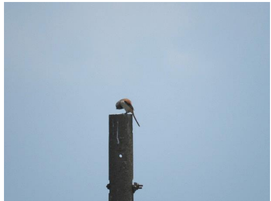
棕背伯勞 (拍攝日期 111.07.25)