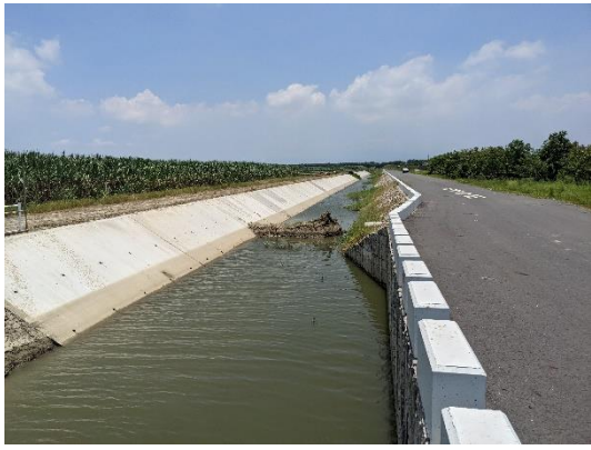
工區現況照 (拍攝日期 111.07.25)