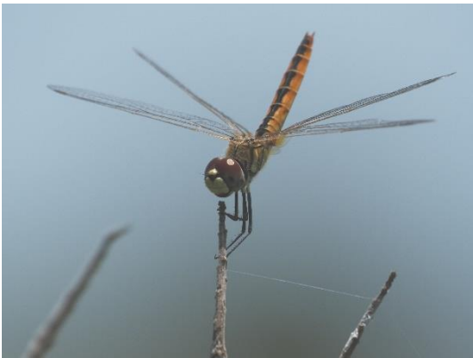
高翔蜻蜓 (拍攝日期 111.07.25)