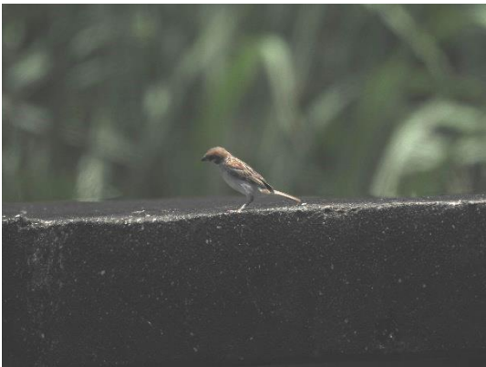
麻雀 (拍攝日期 111.07.25)