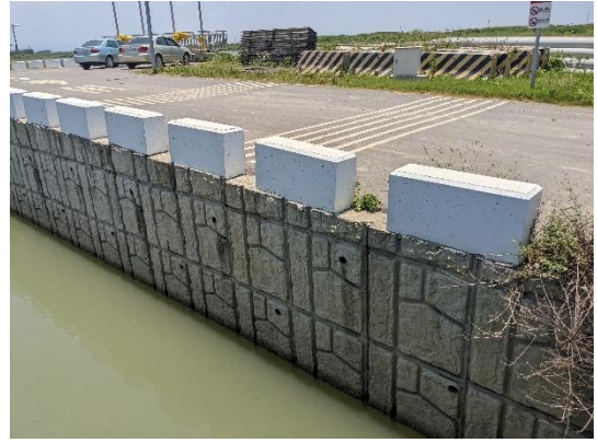
工區現況照 (拍攝日期 111.07.25)