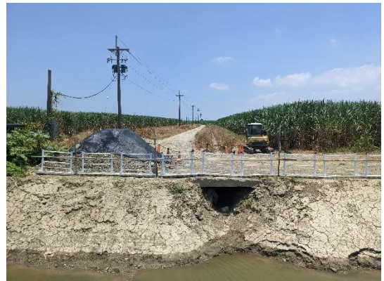
工區現況照 (拍攝日期 111.07.25)