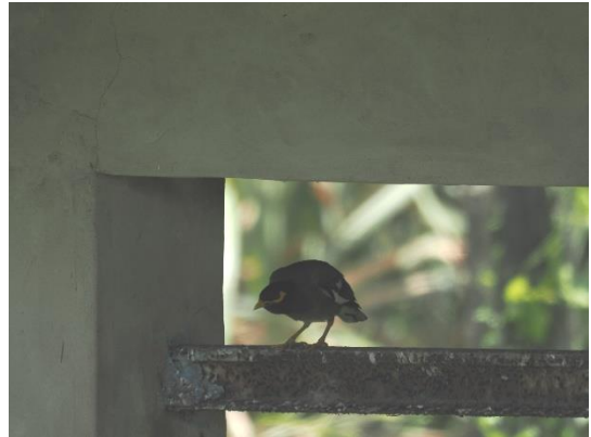
家八哥 (拍攝日期 111.07.25)