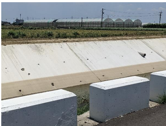
工區現況照 (拍攝日期 111.07.25)