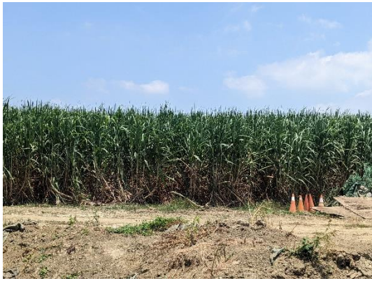
周邊甘蔗田 (拍攝日期 111.07.25)