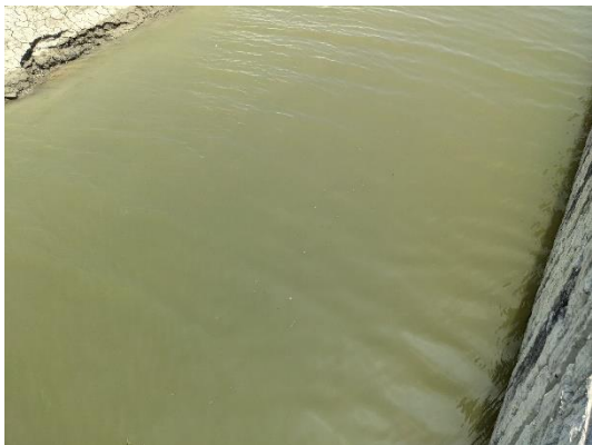
水域狀況照 (拍攝日期 111.07.25)