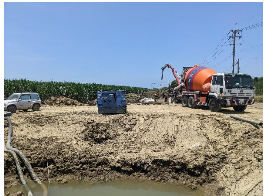
工區現況照 (拍攝日期 111.07.25)