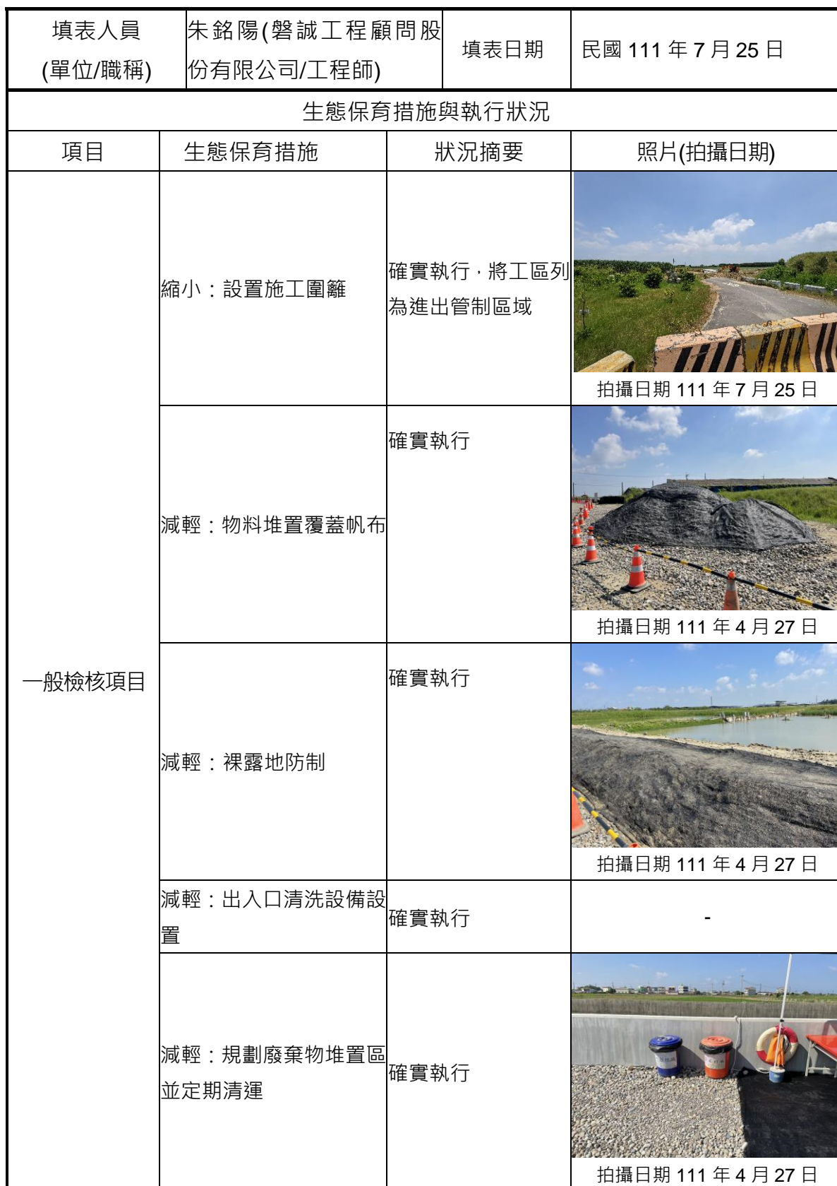
附表 C-06 生態保育措施與執行狀況