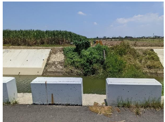
工區現況照 (拍攝日期 111.07.25)