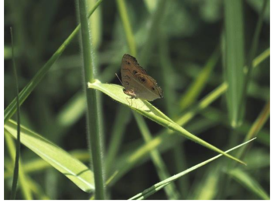
眼蛺蝶 (拍攝日期 111.07.25)