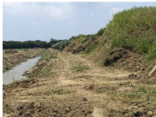
工區現況照 (拍攝日期 111.07.25)