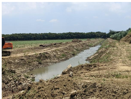
工區現況照 (拍攝日期 111.07.25)