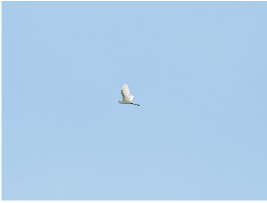
小白鷺 (拍攝日期 111.07.25)