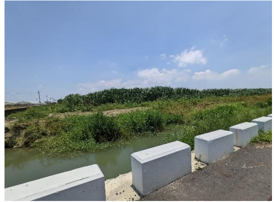
工區現況照 (拍攝日期 111.07.25)