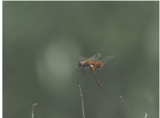
大華蜻蜓 (拍攝日期 111.07.25)